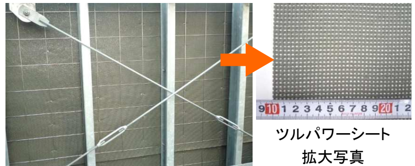
ツルパワーパネル高耐久タイプ 裏側