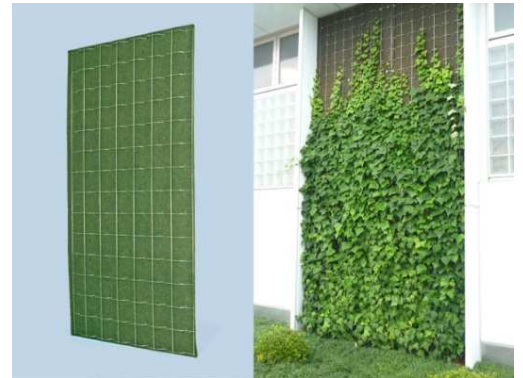
ツルパワーパネル高耐久タイプ 表側

つる植物を10m以上登はんさせる箇所や、鉄骨組み等の構造物で壁面緑化資材の裏側に紫外線が当たる場所において、「 壁面緑化 」と「 長期景観保持 」「 遮蔽効果 」が必要とされる場所に最適の資材です。