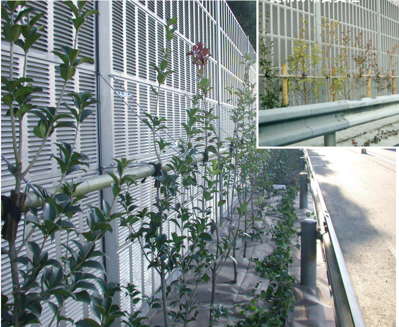
ハンガーポールを用いた布掛支柱 (金属製遮音板標準型)