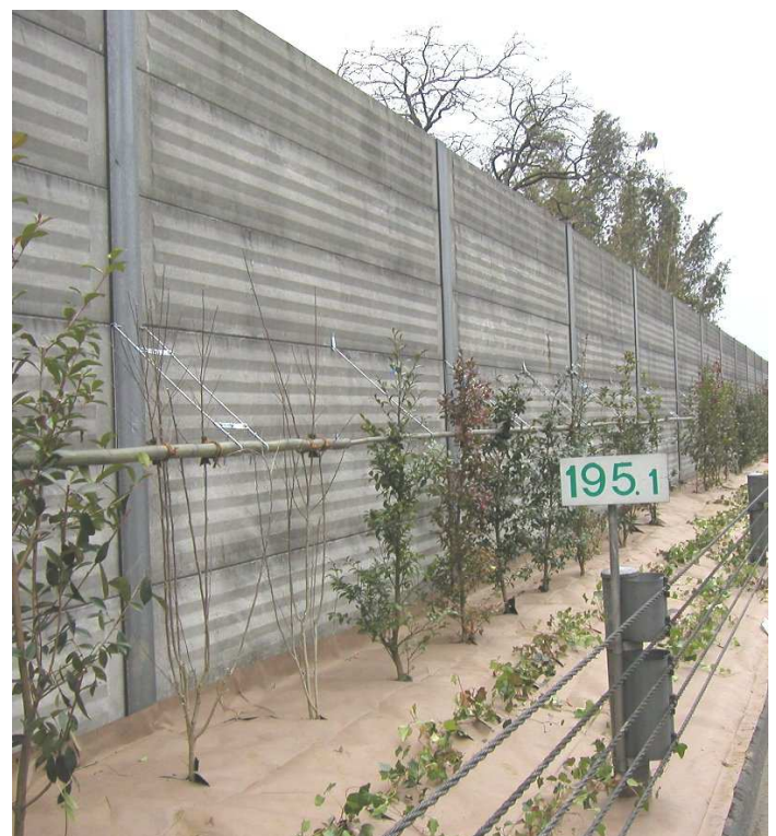
ハンガーポールを用いた布掛支柱 (コンクリート製遮音板)