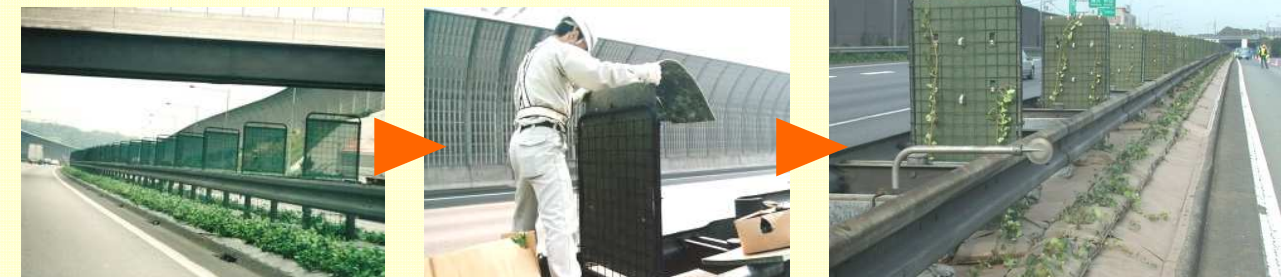
登ハンシートを本体に差し込み、専用の固定部材で簡単に取付けできます。