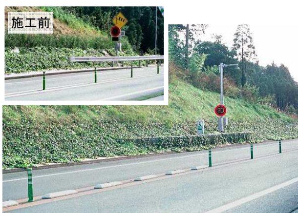
型番: GP-200 千葉東金道路(千葉県) 施工後8ヶ月(3月施工) 樹種: ヘデラ類