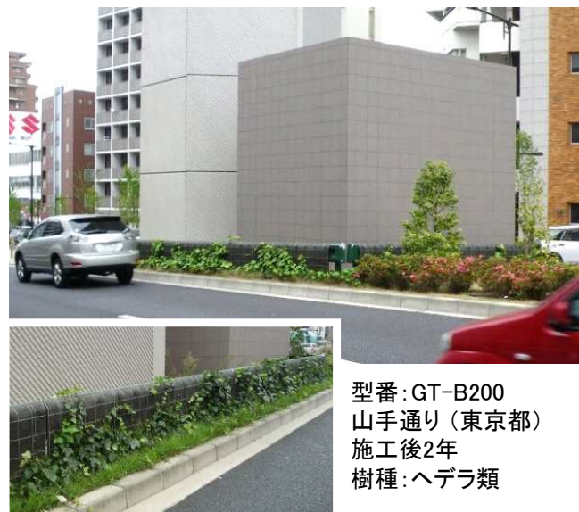
型番: GT-B200 山手通り(東京都) 施工後2年 樹種: ヘデラ類

白く目立つガードレールを修景し、周囲の景観との調和が図れます。 専用フックにて簡単に固定できます。