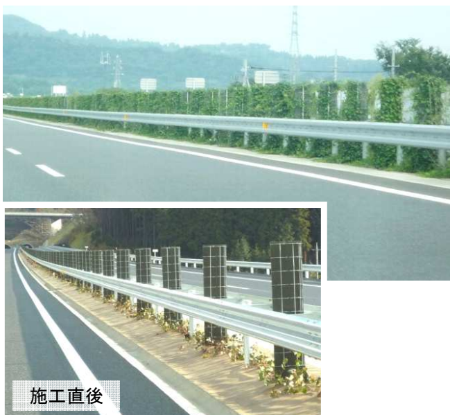
型番:HT-SA 北関東自動車道(群馬県・栃木県) 中央分離帯 施工後 1年6ヶ月(3月施工) 樹種:ヘデラ・ヘリックス