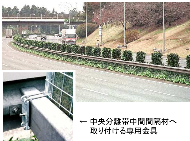
型番:HT-A 東関東自動車道(千葉県) 中央分離帯 施工後 2年9ヶ月(2月施工) 樹種:ヘデラ・カナリエンシス