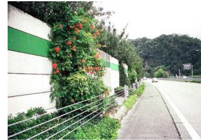
型番:WT-1030 東海北陸自動車道(愛知県) 施工後2年6ヶ月 樹種:ノウゼンカズラ、ヘデラ・ヘリックス