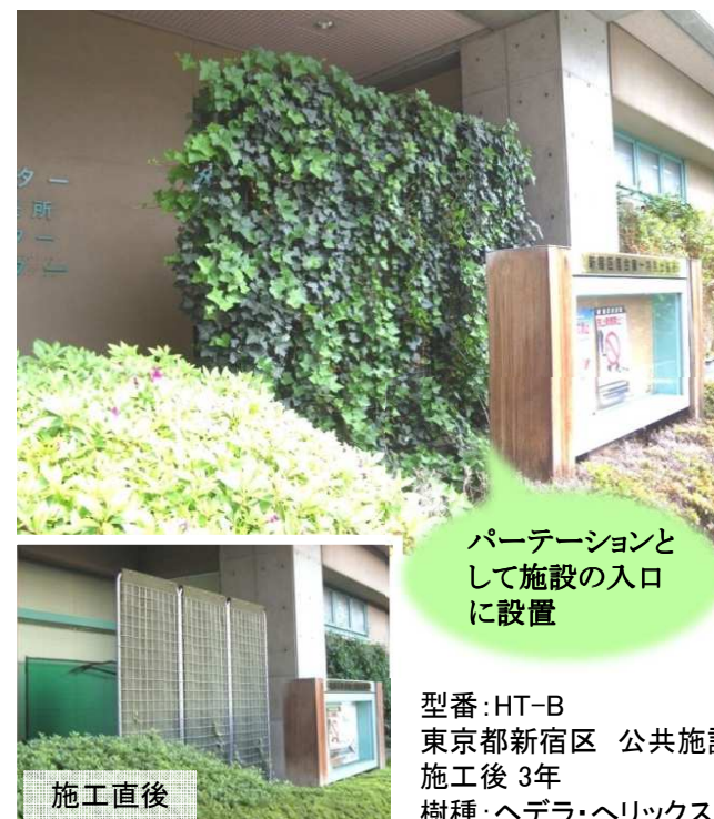
型番:HT-B 東京都新宿区 公共施設 施工後 3年 樹種:ヘデラ・ヘリックス