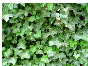
ヘデラ・ヘリックス