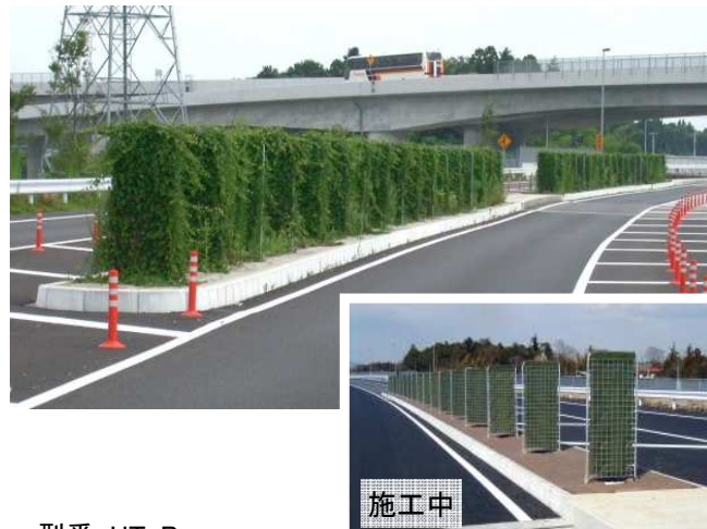
型番:HT-B 茨城県 国道牛久土浦バイパス 中央分離帯 施工後 1年4ヶ月(3月施工) 樹種:ヘデラ・ヘリックス

樹木植栽と比べて、剪定管理を省力化できる緑化型トレリスフェンスです。 両面につる植物を被覆させることができ、みどりのパーテーションとしても利用可能です。