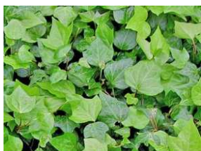
ヘデラ・カナリエンシス