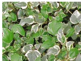
ヘデラ・カナリエンシス "バリエガータ"