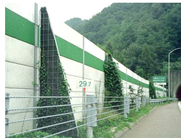
型番:WT-1030 東海北陸自動車道(岐阜県) 施工後7ヶ月 樹種:ノウゼンカズラ、ヘデラ・ヘリックス

疑似樹木により、従来の樹木植栽と比べて剪定管理を省力化できます。 両面につる植物を被覆させることができ、壁の前に彩りがプラスされます。