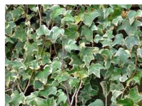
ヘデラ・ヘリックス "グレーシャー"